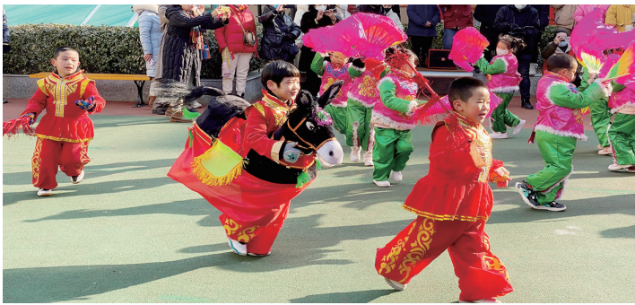
2月3日上午,迎泽街道解放南路一社区新时代文明实践站联合辖区驻地单位苗艺幼儿园,开展“萌娃闹元宵 非遗赶庙会”元宵节活动。在家门口围观这场萌萌的“闹红火”,居民们感受到别样的节日乐趣。