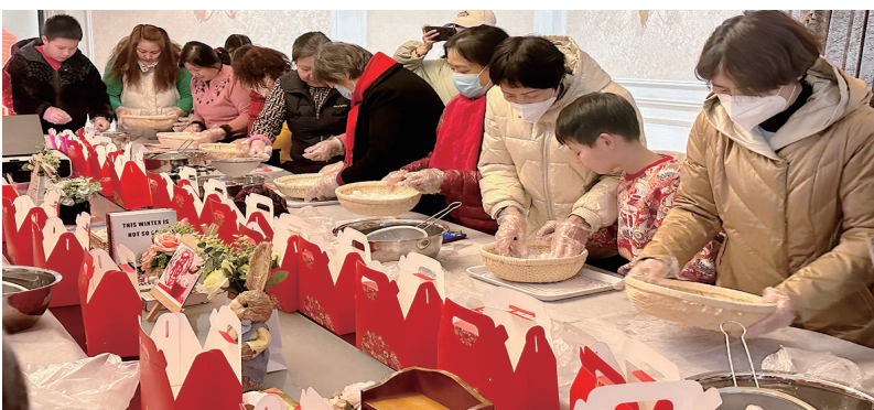
2月2日下午,晋阳街社区携手辖区小区物业党支部共同开展“元宵飘香 花好月圆”主题活动,居民们欢聚一堂滚元宵,感受节日的喜庆氛围。