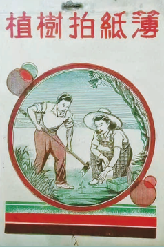
上世纪50年代,中国百货公司山西省公司临汾中心商店监制、临汾小报社承印的笔记本(左),右图为植树拍纸簿。