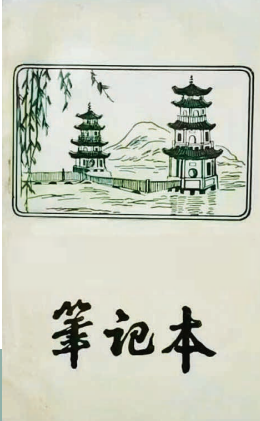
上世纪60年代算草本、笔记本。