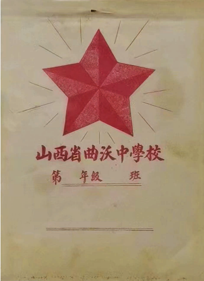
上世纪50年代,山西省曲沃中学校定制的红五星练习本。