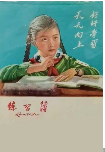
上世纪60年代,太原印刷厂出品的小学生图案练习簿。