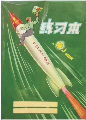
上世纪50年代末,太原印刷厂出品的火箭腾飞图案练习本。