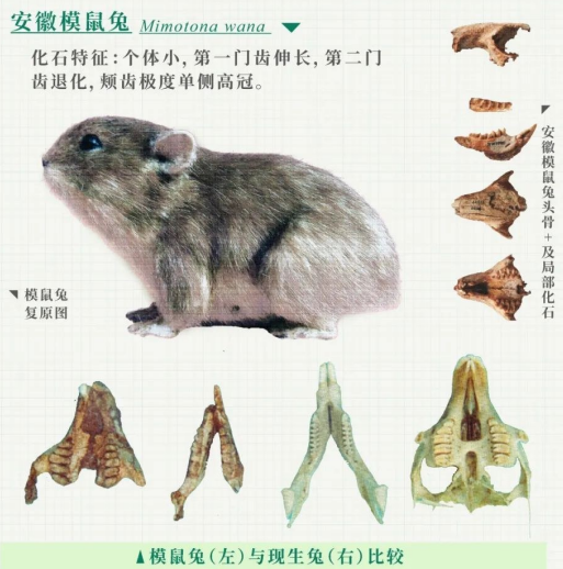
安徽模鼠兔 Mimotona wana

展柜里,一片放大镜下,一块小巧的头骨化石标本来自兔形目动物中最早的代表——远古道森兔。专家介绍,远古道森兔发现于我国内蒙古二连盆地距今约5300万年前的早始新世地层中,标本保存了带额弓的头骨、下颌骨及跟骨和距骨等附肢骨骼,其在骨骼形态上介于模鼠兔和兔形目动物之间,但因具有一对下门齿等典型兔形目特征,而获得“世界第一兔”的称号。