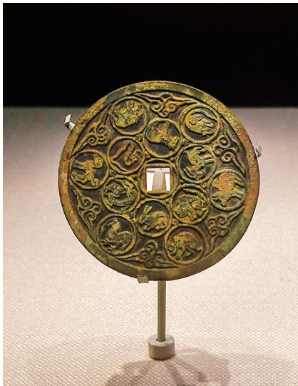
十二生肖压胜铜镜(宋)