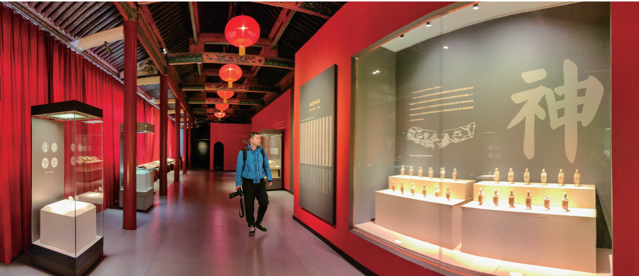
“安辨雄雌——山西出土兔文物展”展厅