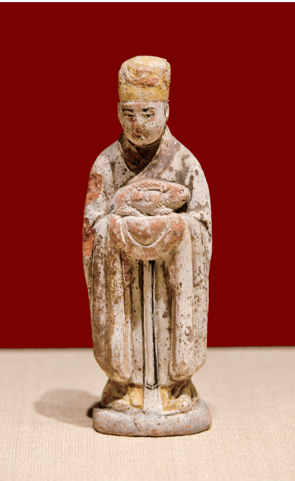
手捧生肖兔陶俑(明)