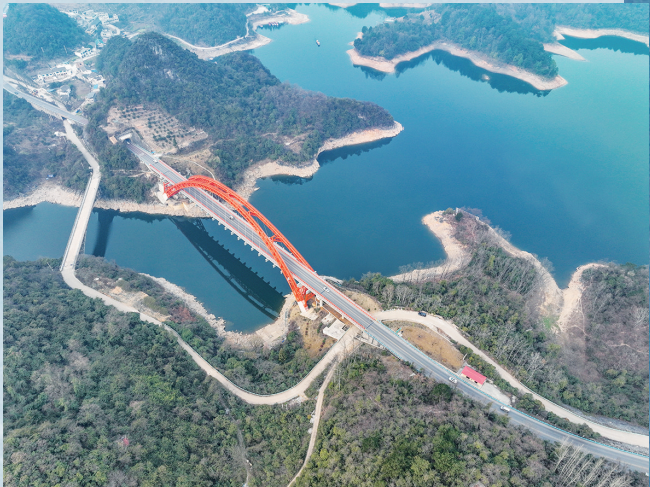
2月1日拍摄的贵州花鱼洞大桥。