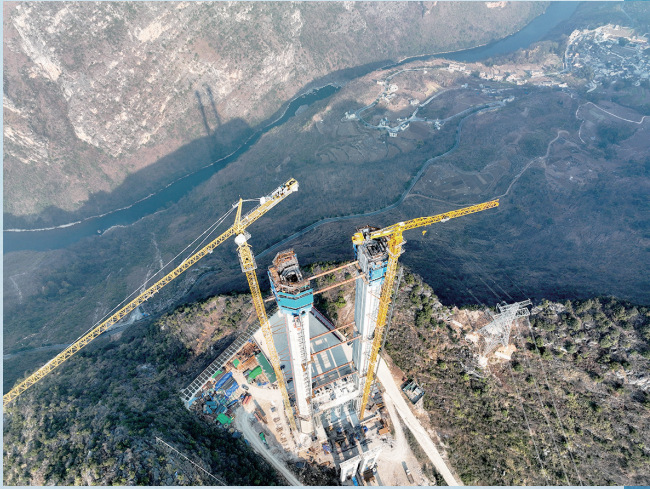
2月1日拍摄的花江峡谷大桥施工现场。