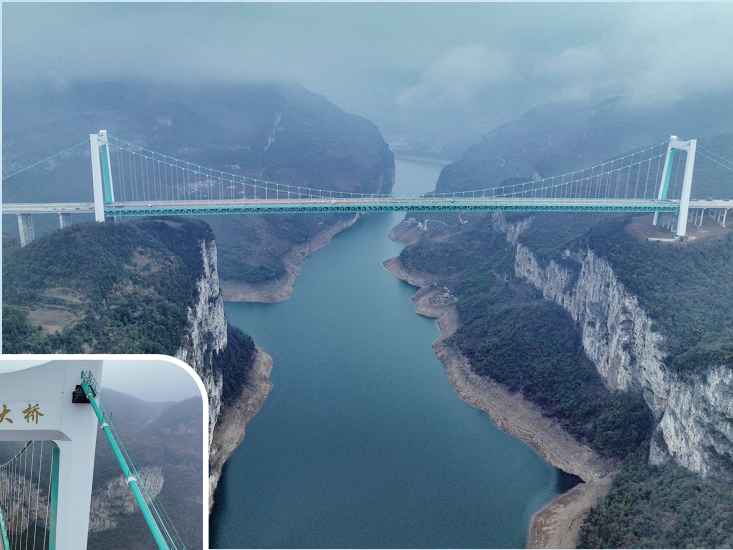
2月3日拍摄的贵州金峰乌江大桥。