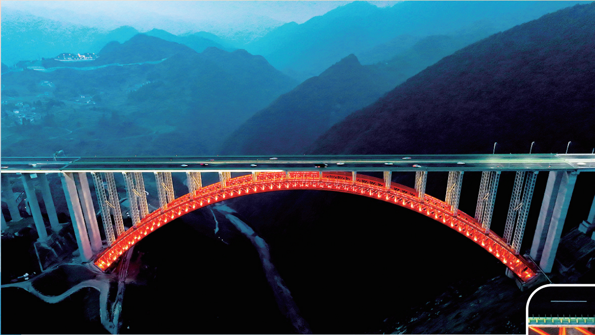
2月2日,夜幕下的大发渠特大桥。