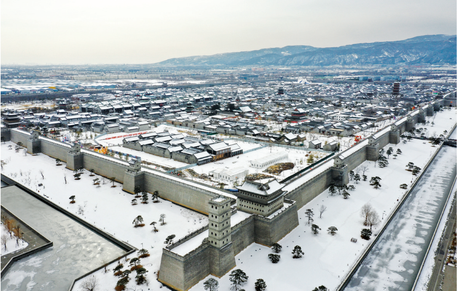
这是2月13日拍摄的太原古县城。