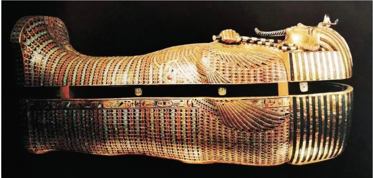
图坦卡蒙的黄金棺(中层)。