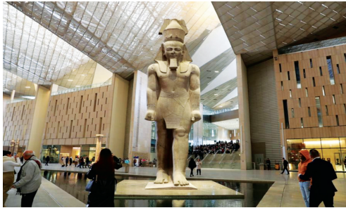
游客在已开放区域参观。

埃及列王及神祇的雕像在阶梯两旁静静矗立。 走到尽头,则是埃及文明中王国国力的巅峰、最著名的法老之一——已有3200年历史的拉美西斯二世雕像。 在日落日出时分,阳光会以绝佳的角度通过广场,洒入整个通道,埃及王室辉煌壮观的氛围感,全面拉满。 建筑外围也充满了古代文明要素,从象形文字到沙漠绿洲,将埃及文化经典具现。整个建筑自身,就是一部千年史诗。 自2002年立项以来,埃及大博物馆的建设可以说是几经曲折。 由于施工难度极大,造价超预算,原定于2015年开馆的时间被一拖再拖到2019年;结果新冠袭来,博物馆再次延迟至2021年;随后埃及遭受内乱,后确定为2022年9月至11月开馆,但不确定因素增多,未能开馆。