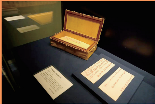
清道光皇帝秘密立储谕旨