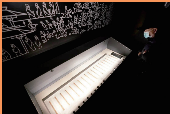
居延汉简展出筒牍