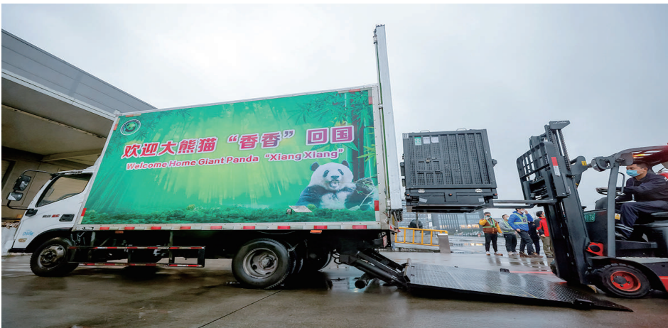
2 月 21 日，大熊猫“香香”在成都双流国际机场海关顺利通关后，准备搭乘货车前往中国大熊猫保护研究中心雅安碧峰峡基地。

“美方曾在阿富汗推行‘战斗到最后一个阿富汗人’的政策，难道今天还要让乌克兰‘战斗到最后一个乌克兰人’吗？”汪文斌说，事实早已撕下了美国“和平捍卫者”的假面具，暴露了其“唯恐天下不乱”的真面目。