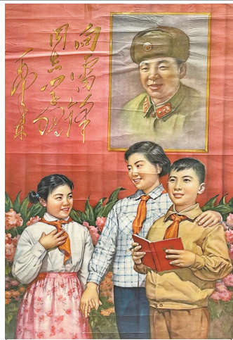
1963年出版的宣传画《向雷锋同志学习》(上图)、1964年出版的宣传画《向雷锋叔叔学习》(下图),歌颂了时代楷模,将弘扬雷锋精神的教育融入了大众文化生活。