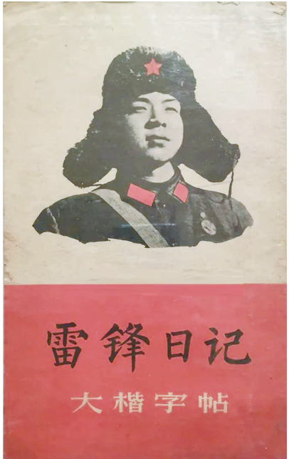
1966年出版的《雷锋日记大楷字帖》,以雷锋日记为内容,用柳体大楷书写,字帖12张,内附笔法图。