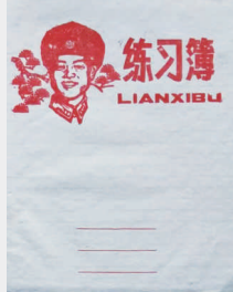
上世纪八十年代练习簿