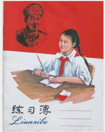
上世纪八十年代练习簿