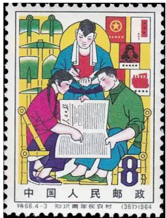
1964年9月26日发行的特66《知识青年在农村》邮票中的第3枚“学习”邮票的背景图上,有一本书《雷锋的故事》,书的封面就是雷锋的木刻头像。