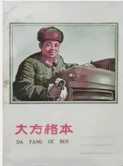
上世纪六十年代早期大方格本