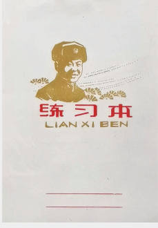
上世纪七十年代练习本