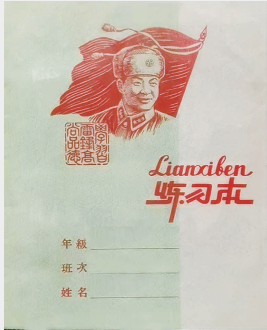
上世纪六十年代练习本