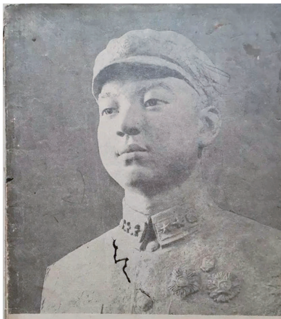
1964年第2期《美术》杂志封面。该杂志由人民美术出版社出版。