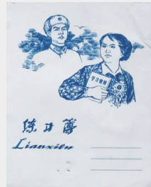
上世纪七十年代练习簿