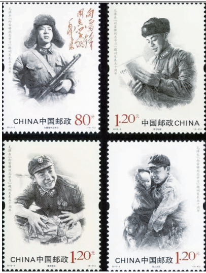
2013年发行的《毛泽东“向雷锋同志学习”题词发表五十周年》纪念邮票,邮票以雷锋当时的部分照片和事迹为素材,采用素描绘画方式,由李晨设计,四枚邮票分别为:向雷锋同志学习、学习钻研、爱岗敬业、助人为乐。