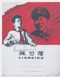
上世纪八十年代练习簿