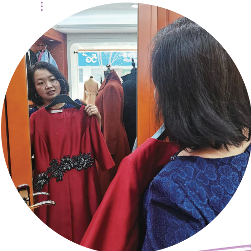
顾客正在桃园四巷服饰定制工作室试穿样衣。