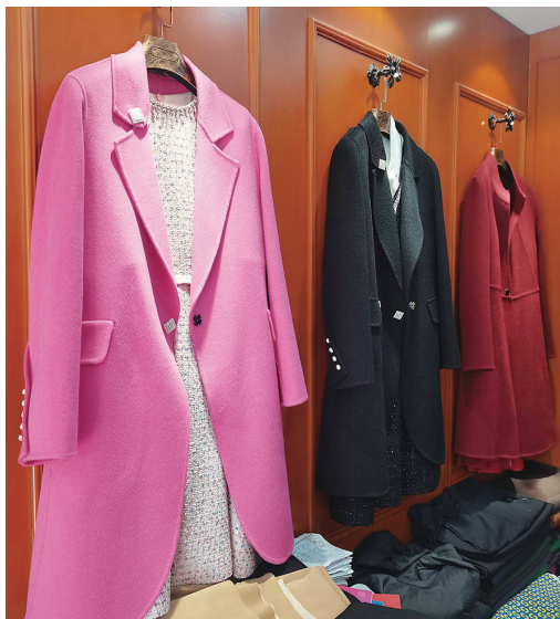
桃园四巷秀秀服饰工作室的样衣。