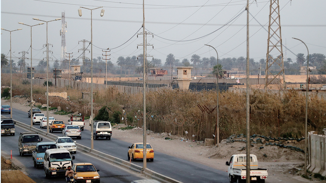
这是3月5日在伊拉克巴格达西郊拍摄的阿布格里卜监狱外景。