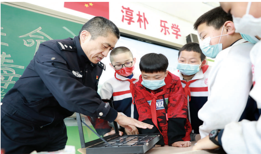
3月21日,郝庄派出所民警联合迎泽区社区戒毒康复服务中心社工,在孟家井寄宿制学校开展禁毒宣传教育,通过展示各类毒品仿真模型,帮助师生更直观地了解毒品危害,提升青少年识毒、防毒、拒毒能力。