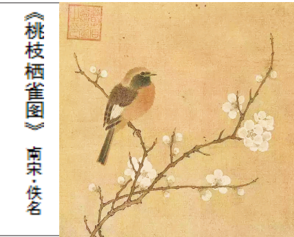
《桃枝栖雀图》 南宋·佚名