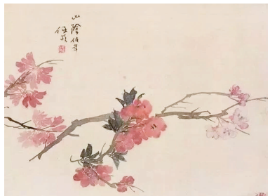
《折枝桃花》清·任伯年