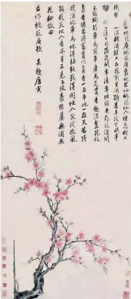
《桃花庵诗图》明·唐寅