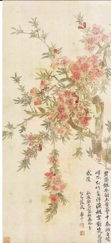
《武陵春色》清·恽寿平