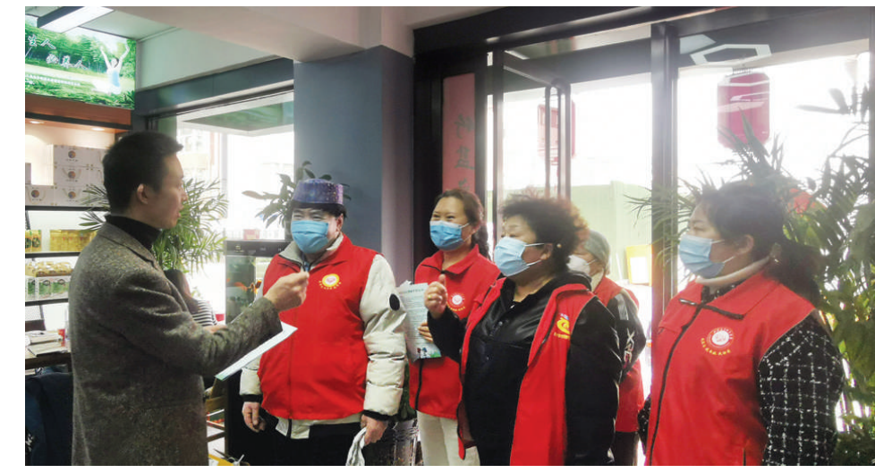
杏花岭区鼓楼街道西羊市社区把志愿服务精神融入民族团结进步事业中,动员和鼓励各族同胞、志愿者广泛开展民族团结进步宣传教育、扶弱济困、文明创建、平安建设等公益活动。图为,该社区组织多民族志愿者,向沿街商铺宣传创城知识,为创城助力。