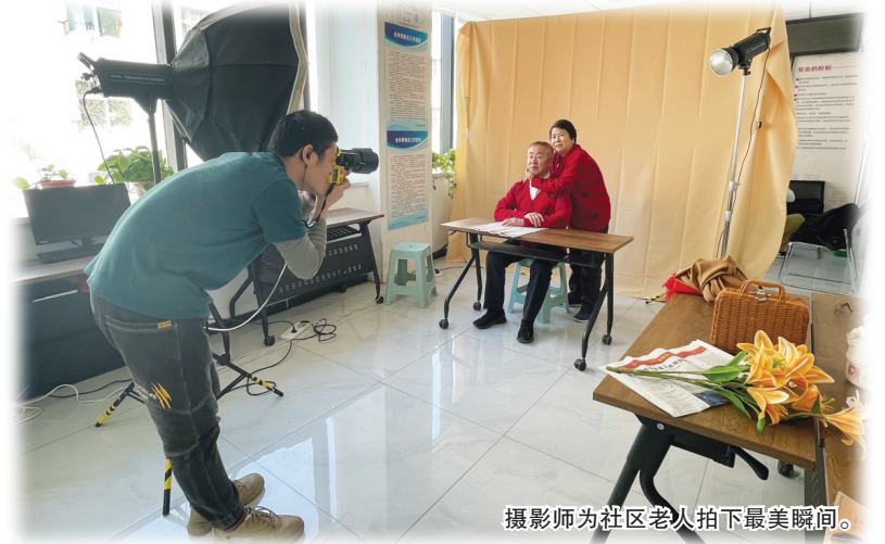
摄影师为社区老人拍下最美瞬间。

本次教学大赛为迎泽区义务教育课堂教学提供了智慧引领和重要借鉴,启发迎泽教育人在教研教学之路上聚焦“新课标”,践行“新教研”,赋能“新课堂”,扎实落实学科核心素养。