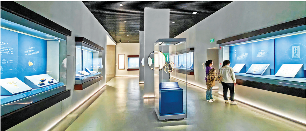
“玉辂华夏”专题展厅