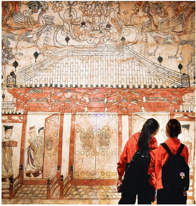
九原岗北朝壁画墓门楼图(北朝)