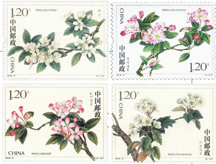
海棠杂项

中国邮政于2018年3月25日发行《海棠花》邮票一套四枚，表现的是楸子、西府海棠、三叶海棠和河南海棠等海棠花，采用雕刻版印刷，栩栩如生。