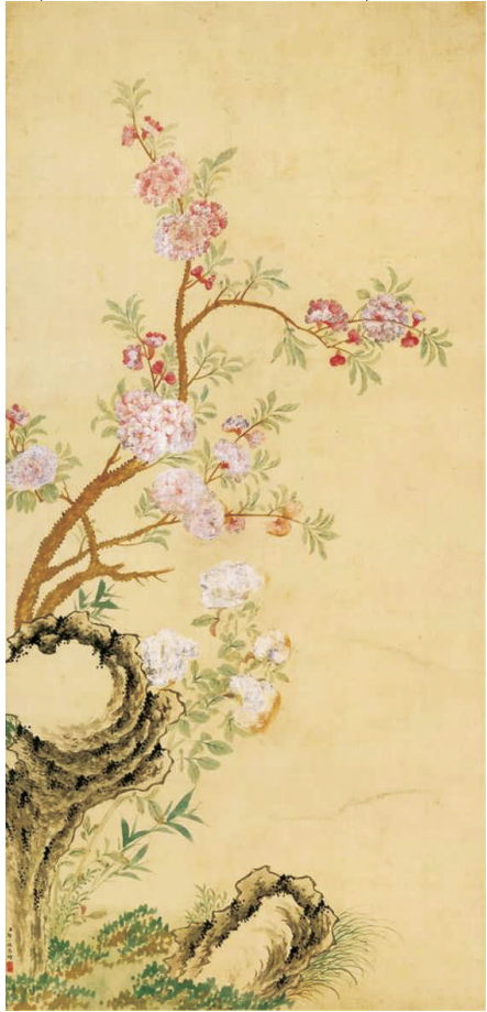
《秋石海棠图》（清）邹一桂