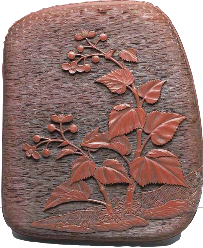
海棠烟标

清代剔红海棠纹砚盒 画面上海棠微垂的弧形枝干一高一低，叶片排列密而不繁，顶端结着花朵与花苞。