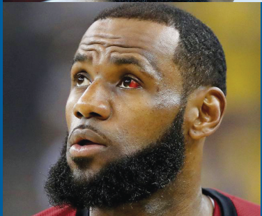
格林戳伤了詹姆斯和哈登的眼睛