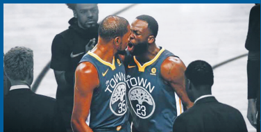
格林曾和杜兰特发生争执