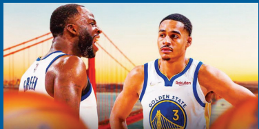
格林在训练中普尔重拳出击