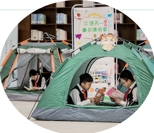
4月22日,为期一个月的太原市图书馆第六届大图读书节系列活动启幕。活动以“世界读书日”为契机,以“阅童”图书盲盒置换市集、市民共读大会等近百场读书活动,营造“爱读书、读好书”的良好氛围,让书香浸润人心。

量、优化读书环境、加强阅读指导,培养学生的读书习惯,持续深化书香校园的建设。该校学生李番表示,没有想到在文瀛公园内竟然藏着这么一个读书的好去处,在放假和课余时间,她会和朋友们来这里读书。 山西新华书店集团太原有限公司总经理高华表示,市新华书店深入开展了一系列丰富的主题阅读活动,推进阅读推广人走进校园,完善阅读服务体系、健全阅读服务机制,努力为青少年营造良好的阅读氛围,让中小学生爱上读书、读有所得、读有所乐,助力全面建设“书香校园”与“书香太原”。接下来,他们还将秉承“助力每一所学校全面发展”的宗旨,与学校合作,进一步深化阅读服务、教育教学服务,用阅读照亮学生们的成长之路。