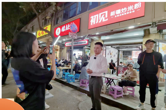
“初见新疆炒米粉”店前,店家正在录制推广的小视频。