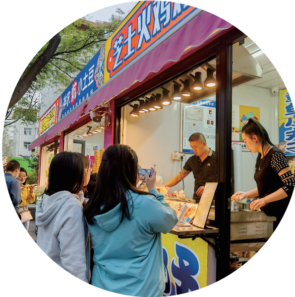
食客就餐期间拍照发朋友圈。

麻辣鲜香的“义井麻辣烫炸串”、外酥里嫩的“台湾车轮饼”、清爽可口的“海南清补凉”、奶香扑鼻的“爆浆鸡蛋仔”……从夕阳西下到华灯璀璨,仅有251米长的老军营东巷,迎接来一拨又一拨闻香而动的老饕,在结束了一天的忙碌后,惬意地坐下来享受“烟火气”的抚慰和滋养。