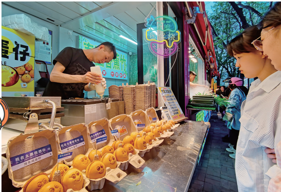
甜点受到女孩子们的欢迎。

为落实今年市政府工作报告中“大力发展夜间经济,推进迎泽区省级夜间经济试点建设,鼓励各县(市、区)举办特色购物消费活动,持续提升城市“烟火气”的要求,老军营街道打造出“美食一条街”,充分挖掘“军营文化”,在原有50家成熟小吃品牌基础上,引入31家美味小吃店,形成新的经济热点。