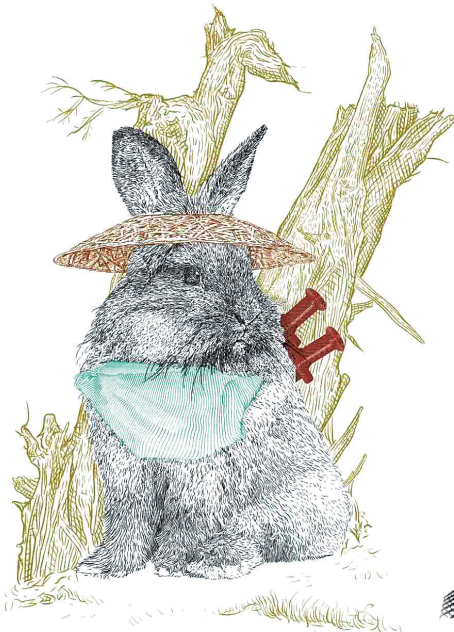
纪念券上的图像十分精细