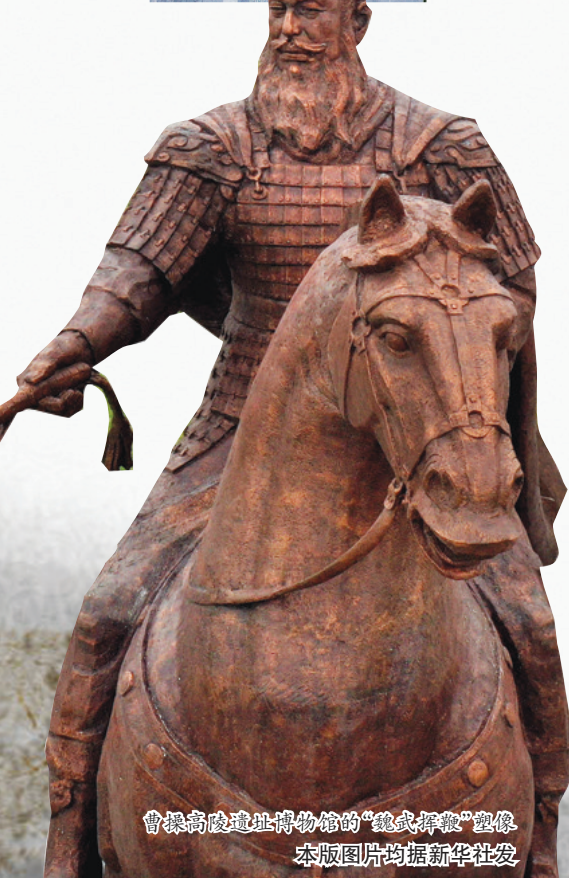
曹操高陵遗址博物馆的“魏武挥鞭”塑像

博物馆展陈的文物远不止这些,除陶器、铁器、骨器,还有少量瓷器、铜器,共400余件(套)精美文物。