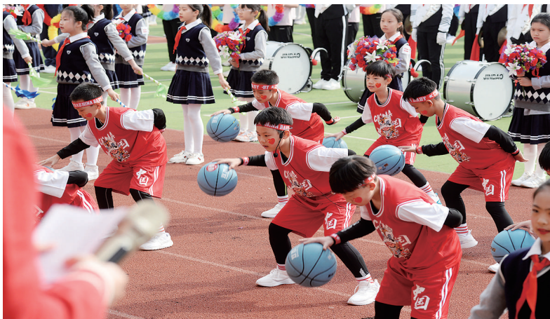
4月27日,双西小学2023年“慧运动”体育节开幕。同学们通过丰富多彩的比赛项目感受运动的乐趣。

注意饮食卫生。选择正规餐厅就餐,尽量吃熟食,不吃生的或未煮熟的肉类、海鲜、蔬菜,不要采摘食用不认识或不能确定是否有毒的野菜,吃水果要清洗、削皮,饮用开水或未开封的预包装水、饮料,食用有包装食品时,要注意生产日期和保质期,警惕食源性疾病的发生,出现腹泻、腹痛、恶心、呕吐等消化道症状时,要及时就医。