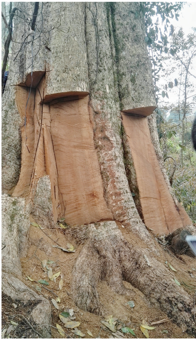
贵州省黔东南州一株被切块盗割的楠木。

“新华视点”记者近期调查发现,盗伐贩卖古树名木往往发生在夜间的林区,且多为跨地区流窜作案,侦破难度很大。尤其值得关注的是,部分地区管理者对古树底数掌握不清、管理不善,当地一些百姓保护意识欠缺。