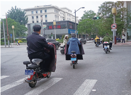
起凤街和柳巷南路的路口,部分骑行者未佩戴头盔。

然而,也有少数人未按要求佩戴头盔,这个情况在小路口尤为突出。当天上午,出行早高峰尚未过去,起凤街和柳巷南路路口的往来车辆、行人较多。东西向的信号灯变绿后,一名女子戴着耳机,骑着电动自行车快速驶过,一个粉色的头盔挂在车把上,而头上没有任何防护。很快,一名男子路过,后座还坐着人,两个人都没有佩戴头盔。过了一会儿,又有一名女子骑着电动自行车经过此处,本应佩戴在头上的安全头盔,却被放在车筐内。记者发现,像这种将“佩戴头盔”变成“携带头盔”的情况,不在少数,基本都是看见远处有执勤交警时才匆忙戴上。而且,仔细观察,部分骑行者虽然佩戴了头盔,却不系卡扣,防护带松松垮垮,实则起不到保护作用。