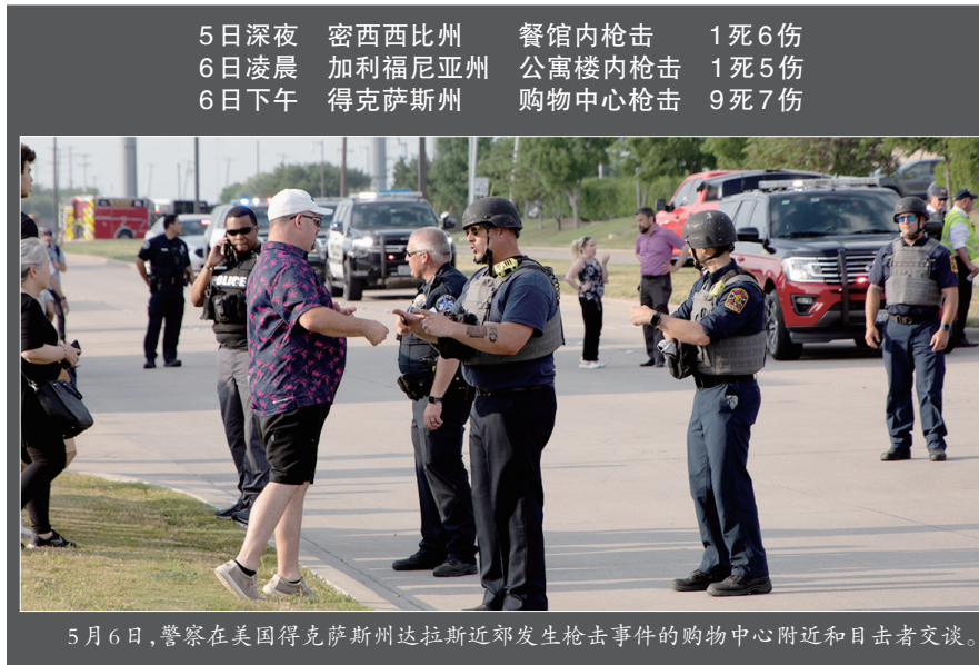
5月6日,警察在美国得克萨斯州达拉斯近郊发生枪击事件的购物中心附近和目击者交谈。

案发地所在居民区位于加利福尼亚州立大学奇科校区附近。警方认为这是一起孤立事件,不会威胁整个社区。奥尔德里奇说,枪击发生大约半小时前,警方接到报警电话来到同一地址,逮捕一名涉嫌挥舞枪支的男子。该男子可能在零时