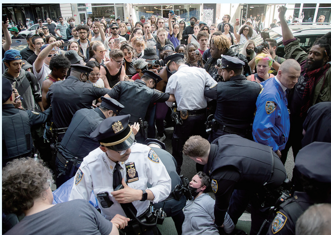
5月6日,在美国纽约,警察与抗议者发生冲突。

曼哈顿地区检察官办公室4日发表声明说,调查人员将查看法医报告,评估所有可获得的视频和照片,尽可能多地与目击者面谈,并获得更多医疗记录。纽约市长埃里克·亚当斯呼吁人们不要急于判断,应让检方联合执法