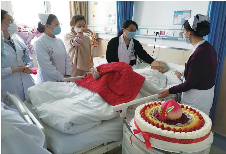
老年病科医护人员为患者过生日。