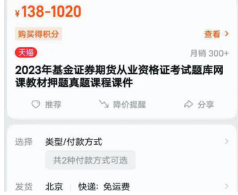
“保过”押题服务的购买界面。