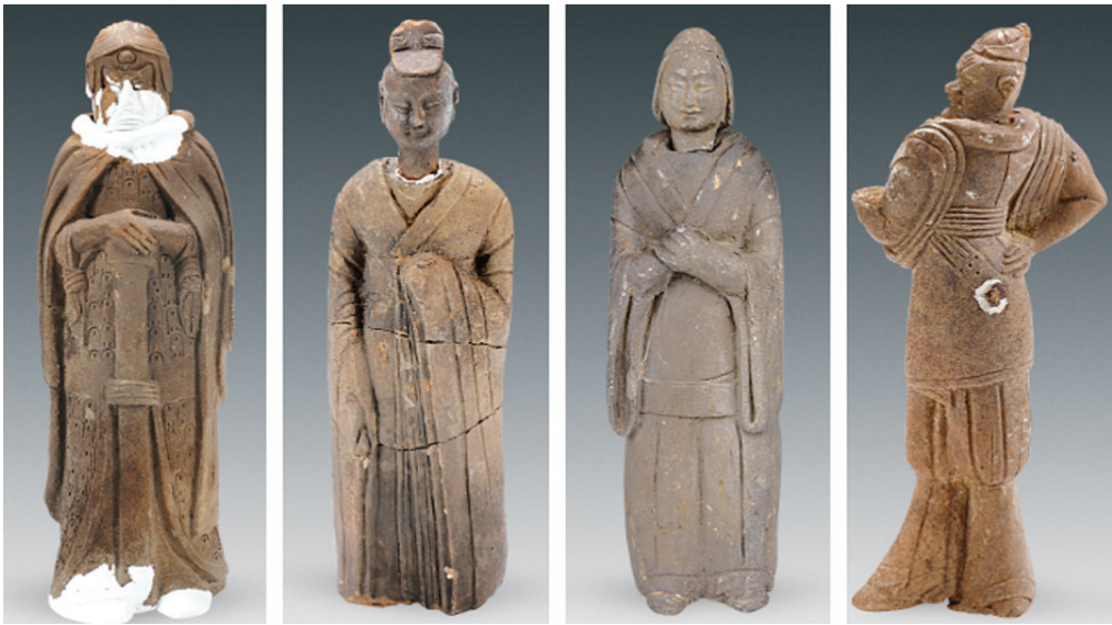
出土的陶俑。 本版图片均据文博山西