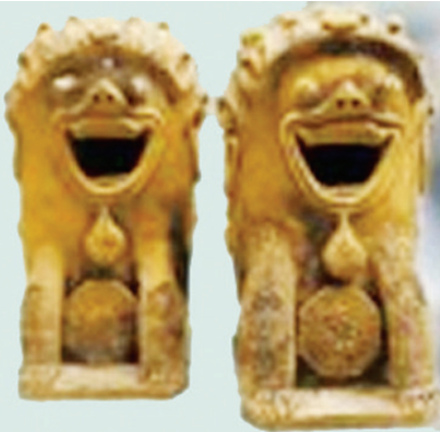
金门风狮爷大门陶灯座