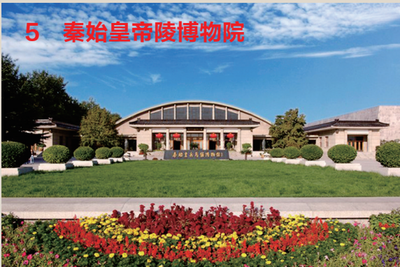
5 秦始皇帝陵博物院

因为依托的一座大型遗址博物院。俑博物馆为基础,以秦始皇帝陵遗址公秦始皇帝陵博物院以秦始皇兵马俑