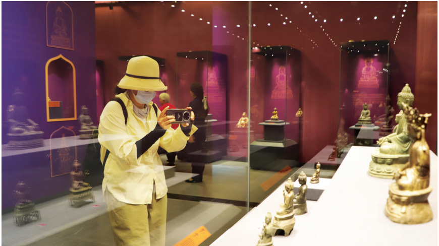
5月18日是国际博物馆日。当日,市文物局主办的太原市博物馆藏铜佛造像展开展,展出文物共计34件(套),以此让更多市民感受中华优秀传统文化之美。

查,对停车区域仔细摸排。运力在太马赛事期间全员出勤,并协调应急运力团队随时待命,降低车辆淤积的风险,及时回收故障车回仓维修。针对太马赛事重点保障路段点位及人流量密集点位,安排专人驻守岗位巡查,同时要求各区管理人员对路段巡查汇报。 美团出行和青桔出行在每个负责区域安排了调度车辆和运维人员,运维人员均身穿工作服,佩戴文明标语袖章在赛道沿线引导用户规范停车,规范不文明停车行为,配合调度车辆进行调度清运工作,确保比赛期间赛道周边车辆清零。