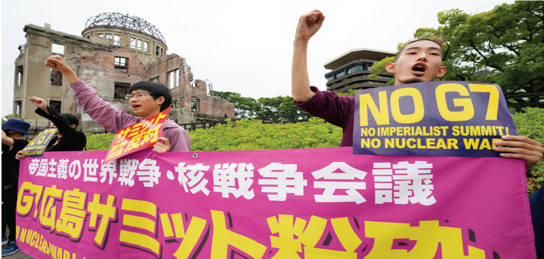
▲5月18日,民众在日本广岛和平纪念公园集会反对七国集团峰会。 ▶5月17日,民众在日本广岛举行抗议活动,反对七国集团峰会。