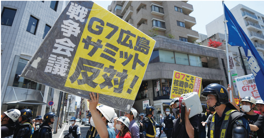
5月21日,民众在日本广岛游行抗议七国集团峰会。

“反对战争!”“粉碎峰会!”……抗议人士21日在数百名全副武装的防暴警察重重包围下在日本广岛市中心缓慢前行,他们手持各色标语牌,不断呼喊着口号,激昂的声音回荡在空中。