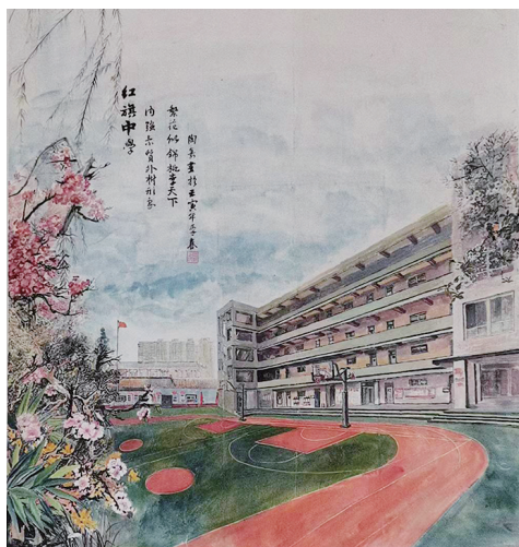
我的校园 陶嘉 (太原市第四十五中学校)