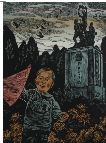
张雪青 (太原幼儿师范专科学校) 不能忘却的纪念 (版画)