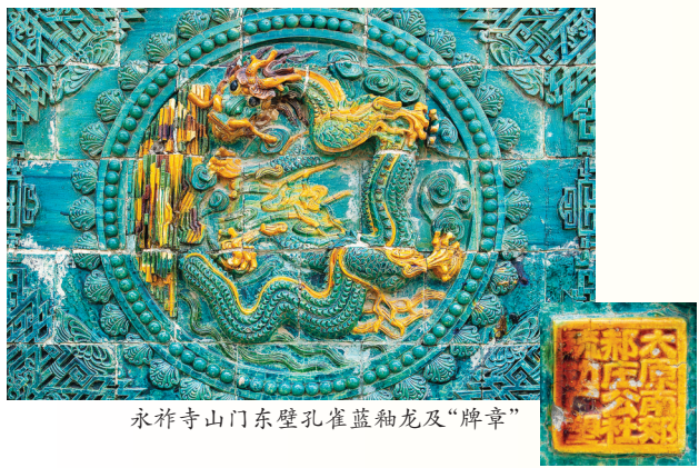
永祚寺山门东壁孔雀蓝釉龙及“牌章”