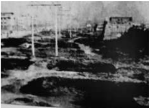
1952年建设中的新建路,右侧为城墙、城楼,左侧为新建市政府大楼,道路是占用原护城河所建。

1959年,将各区清洁队和原下放到公社的清运城肥汽车收归市管,重新组建为一、二、三卫生队,统归市卫生大队领导,使垃圾、粪便清运工作步入了正轨。并在城东一处高地(现新源里小区)建立了集体所有制肥料站,铺设236米的铁路专用线。利用垃圾拌粪便,泥粪发酵堆肥,日堆肥60多吨,为后来的综合利用垃圾、粪便积累了经验。