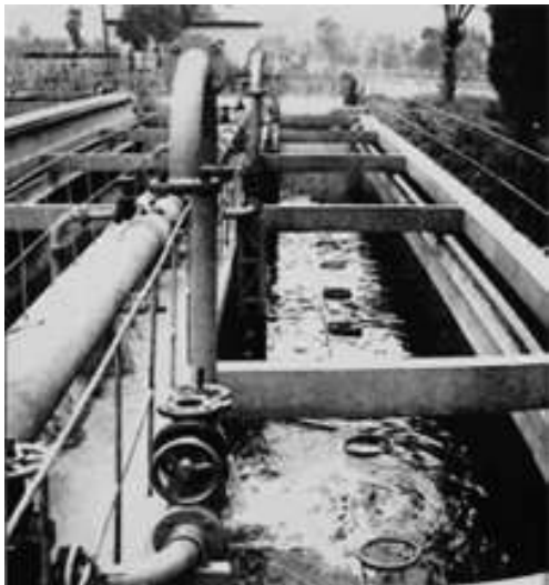
1956年新建的北郊污水处理厂,是太原市第一个污水处理厂。