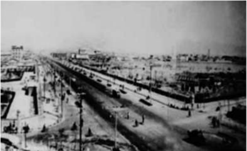
上面两图均为上世纪50年代新建的迎泽大街,拍摄于不同年份和地段,拍摄角度也不同。