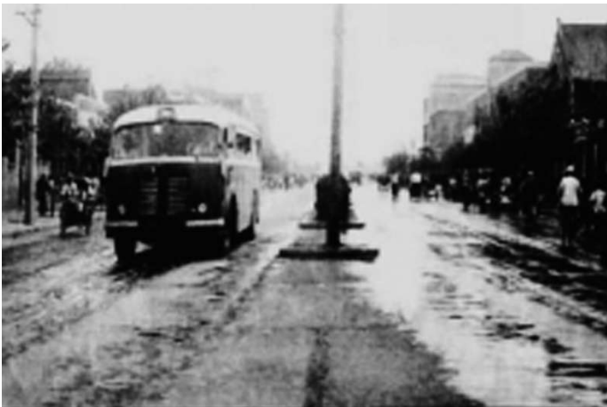
1952年新建的五一路,为全市首条柏油路,当时已有公共汽车。