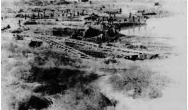
1955年,迎泽公园兴建中。