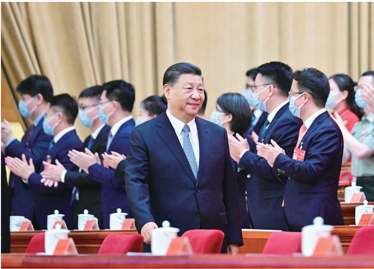
6月19日，中国共产主义青年团第十九次全国代表大会在北京人民大会堂开幕。这是中共中央总书记、国家主席、中央军委主席习近平步入会场。