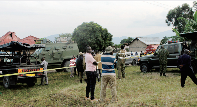
6月17日，在乌干达西部卡塞塞地区，安全人员聚集在遭到袭击的卢比里拉中学附近。