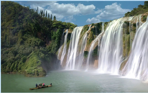
《黄果树听瀑》 杨国民

黄果树瀑布落在一片群山环抱的谷地，我们自西面顺着石阶下行，山径寂寥无人，“哗哗”的瀑布声在山谷间震荡着、回响着，似千百架低音提琴在奏鸣、在轰响。 至谷底，我们坐在水边的一块岩石上，隔着一口小小的绿潭，那一幅白帘般的瀑布，仿佛一伸手便可撩过来拭脸似的，它跃入涧底激起的水珠，直扑到我们脸上，沁凉沁凉的。