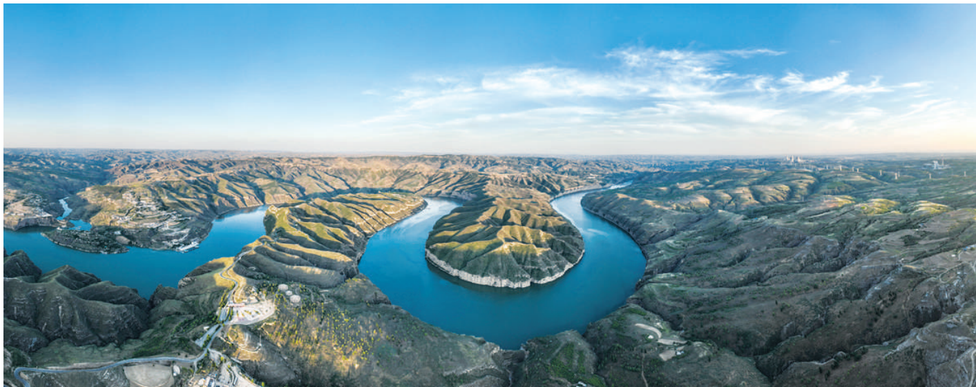
落日下的黄河大峡谷 这是6月20日在内蒙古鄂尔多斯市准格尔旗拍摄的黄河大峡谷(无人机全景照片)。 夏日时节,蒙晋陕黄河大峡谷在落日余晖的映照下壮美如画。

形成分工负责、密切配合的执法协同机制,对于从事非法文物交易,以及文玩市场、网络平台失职失责疏于监管的现象依法追责,严肃查处文物流通领域的违法违规活动。”彭新林建议。 警方提醒消费者,古玩爱好者要增强法律意识,通过公开、合法渠道获得藏品,不要轻信他人私下交易,防止无意中踩上法律红线。新华社北京6月20日电