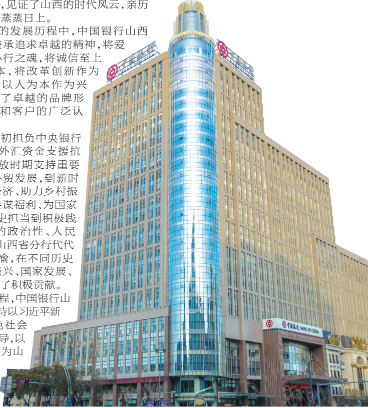
中国银行山西省分行现址(太原市平阳路186号)