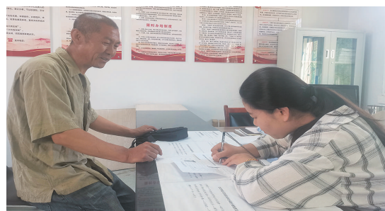
代办员帮忙填写相关信息。

本报讯(记者 刘志刚 通讯员 张云文/摄)“我们年龄都大了,不会网上操作,子女又离得远,工作人员很热心,替我们操作,真是应了那句话‘事情不好办,就找帮代办’。”6月28日,在古交市邢家社乡便民服务中心,面对代办员的贴心服务,弓大爷连声道谢。