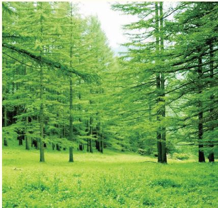
庞泉沟国家级自然保护区