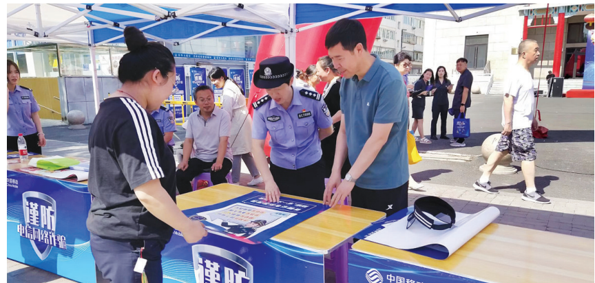
图为反诈活动现场。

识不强,常常成为诈骗分子的对象,有你们这些‘红马甲’,现在我们能安心很多。” 当天,宣讲员们共发放宣传资料150余份,张贴“平安并州”宣传海报20张,有效提升了反诈宣传的影响力和覆盖面,以数字赋能小区治理宣传和推广,让便民服务更加精准有效。