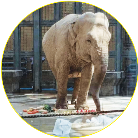
工作人员在大象馆舍放入许多冰块,消暑解渴。