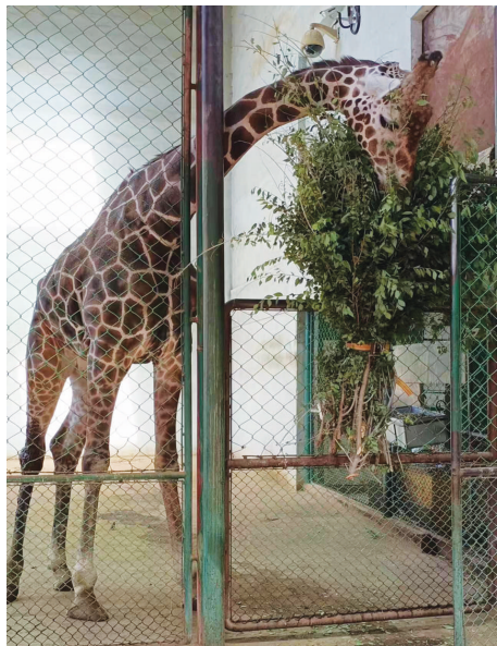
一长颈鹿由于腿受伤行动不便,工作人员给了许多新鲜枝叶喂它,中间还有萝卜、西瓜等。