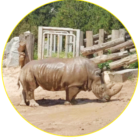
工作人员给犀牛冲凉降温。