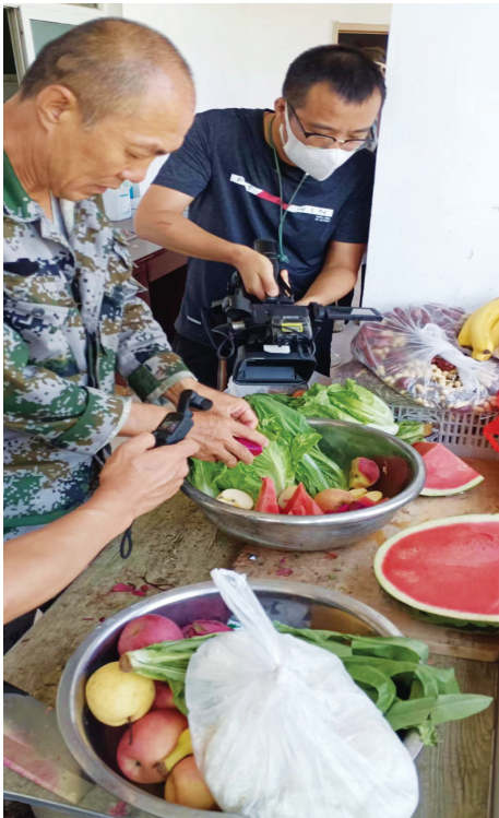
工作人员在给动物配餐,西瓜、苹果、桃子、火龙果、生菜、萝卜、红枣,颜色鲜艳、营养丰富。