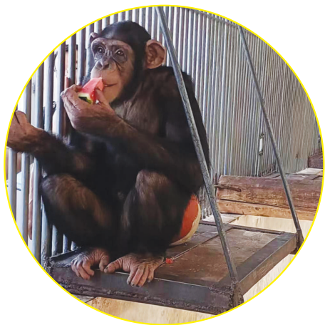
黑猩猩吃西瓜,吃得不亦乐乎。