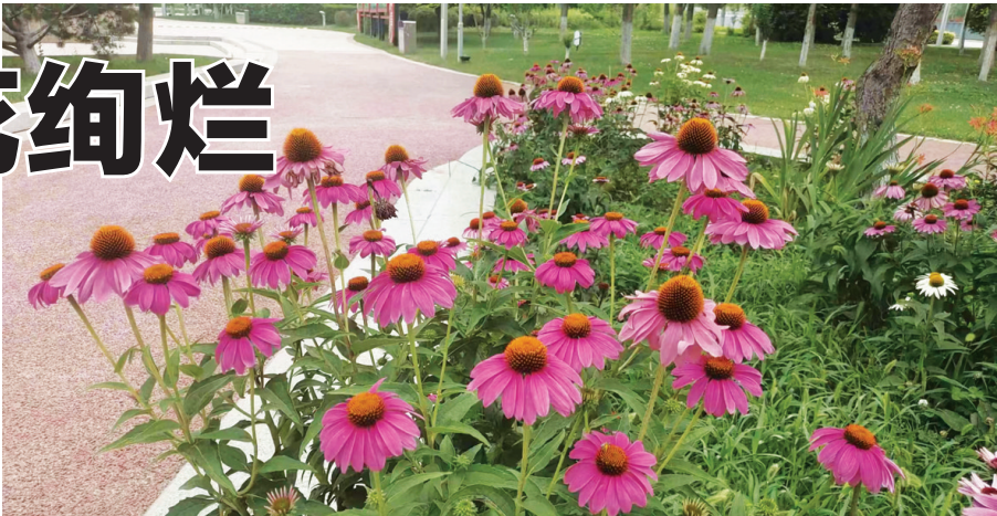
滨秀园松果菊一簇簇、一蓬蓬,引得蜂、蝶流连其间。

绿的茎子,像一位美丽的少女在眺望远方。 夏季的花以草花居多,其中菊科品种占据了大半风景。学府公园的陀螺菊、天人菊,滨秀园的万寿菊,南海子公园的黑心菊,晋阳街公园的松果菊,狄仁杰文化公园的蛇鞭菊等,或紫或黄、或粉或白,不仅艳丽幽香,还具有花期长、生命力强的特点。 还有太原植物园,数十万株鲜花竞相绽放。月季花、荷花、菊花等之外,一些“小草”也颇引人注目。比如金娃娃萱草,是人工栽培的园艺品种,株高30厘米,花茎粗壮,花冠漏斗形,花径约7至8厘米,金黄色。6月至7月为盛花期。还有毛地黄,花开时花箭高高耸起,一开一大串,非常惊艳。但要提醒的是,毛地黄是一种有毒的植物,所以欣赏即可,切忌入口。