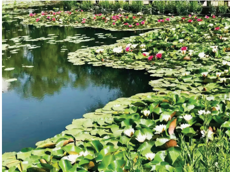
迎泽公园睡莲开得正艳,仿佛“水上花海”。