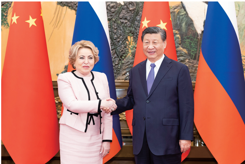
7月10日下午,国家主席习近平在北京人民大会堂会见俄罗斯联邦委员会主席马特维延科。

索加瓦雷表示,同中国建交是所方作出的正确选择。建交以来,两国关系取得累累硕果。中国已经成为所罗门群岛最