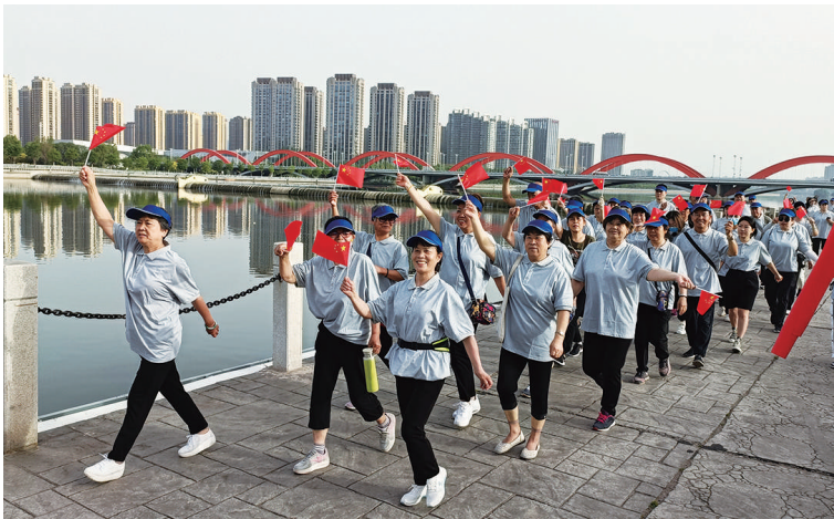
7月14日,兴华街道新悦社区组织辖区50余名居民开展户外健步走活动。参加活动的居民们统一穿着,精神饱满地沿着汾河景区步道前行,伴随着热情的音乐、感受着凉爽的微风,大家脚步轻快,边走边聊,在欢声笑语中强健体魄。